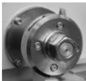
回転軸直径：25.4mm 刃直径：78mm